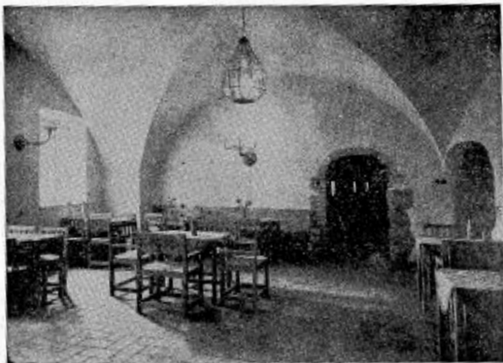
"Källarsalen" i Domtrappkällaren.

Ett av Sveriges äldsta profana rum ingår i lokaliteterna i den unika, lika historiskt intressanta som stilfulla kaférestaurang, Domtrappkällaren vid S:t Erikagränd, som på onsdagen öpp- nas för allmänheten. Det nämnda rummet är den s. k. "Kerran" som enligt traditionen är universitetets gamla Carcer eller fängelse för studenter. (Forts. å 8:s sid.)